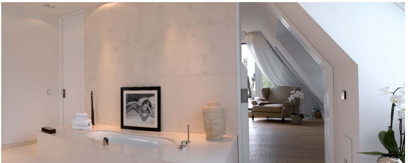
Die Schrägen des Dachgeschosses wurden geschickt in die Raumgestaltung mit einbezogen