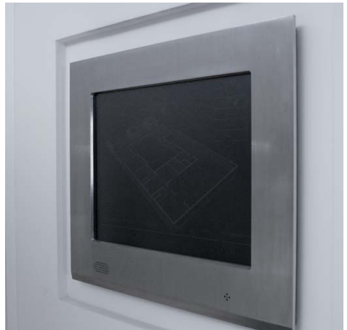
Die Haustechnik wird dank der Visualisierungen mit Grundrissen übersichtlich

So lassen sich Lichter und auch die Dachflächenfenster souverän per Smartphone oder Tablet überwachen und steuern. Ebenfalls up to date: Die Zugangskontrolle mit den Zylindern von Simons-Voss, die sich per Transponder, Keypad oder Fingerprint steuern lassen und so klassische Schlüssel verzichtbar machen. Auch Sicherheit wird hier groß geschrieben, eine Alarmanlage von Bosch und eine ausgedehnte Videoüberwachung von Panasonic sichern die Gebäudehülle und lassen die Bewohner ruhig schlafen.