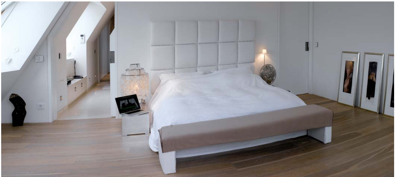
Via Notebook im Schlafzimmer hat man ebenfalls Zugriff auf die Musiksammlung

Das loftige Leben über Berlin rundet erst der richtige Soundtrack perfekt ab, und so gehört eine Multiroom-Beschallung hier zum guten Ton. Tim Skrok kombinierte vorhandenes Equipment wie einige bereits verlegte Lautsprecher mit moderner Technik. Die bereits erwähnten Crestron-Komponenten verteilen die unterschiedlichen Quellen auf die verschiedenen Bereiche des Apartments. Verstärker von Dynacord liefern satte Leistung für die insgesamt 18 Audiozonen, sodass auch ernstzunehmenden Parties nichts im Wege steht.