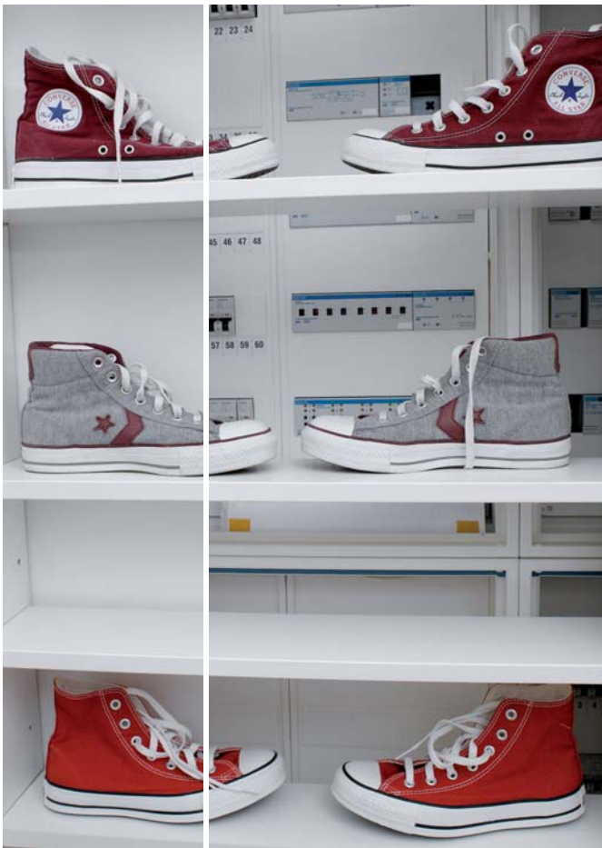
Technik hinter Chucks: Eine verschiebbare Schrankrückwand gewährt Zugriff auf die Hauselektrik

Hier entstand der Traum eines jeden Großstädtlers: Ein Rückzugsort inmitten der Stadt, der gleichzeitig durch riesige Fenster den Blick auf das hektische Treiben wahr, auf der anderen Seite aber die Option bietet, sich auf dem Dachgarten mit Blick in den Berliner Himmel zu verlieren. Wenn dann noch aus allen Räumen der perfekte Soundtrack zur Stadt tönt, dann lässt es sich auch in einer Millionenmetropole hervorragend entspannen. ☺