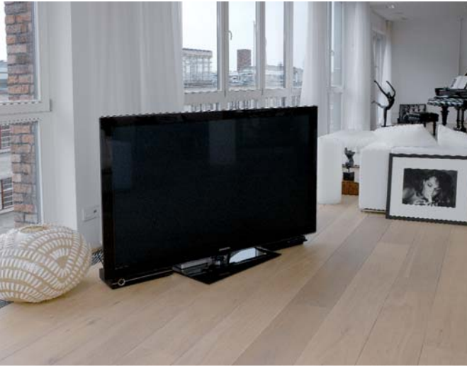
Lässig: Wie auch die gesammelten Fotografien im Haus hat der großformatige LCD-Bildschirm einen Platz auf dem Boden gefunden

Neben iPad und iPhone, die ja immer mal wieder durch ihre „gewöhnlichen“ Funktionalitäten blockiert sind, sorgen vier im Haus verteilte Pronto Fernbedienungen, je zwei TSU 9600 und 9800 dafür, dass alle wesentlichen Funktionen der Haustechnik schnell und unkompliziert erreichbar sind. Die Technik, zumindest der Part, der ab und an zu Kontrollzwecken zugänglich sein muss, ist in einem Schrank im Ankleidezimmer verborgen. Hinter den wohlsortierten Chucks der Hausherrin lassen sich die Rückwände eines Regals zur Seite schieben, und die Hauselektrik liegt griffbereit da.