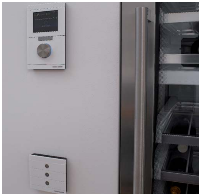
Bedienelemente und Raumcontroller von Busch-Jaeger steuern die moderne KNX-Technik des Objekts