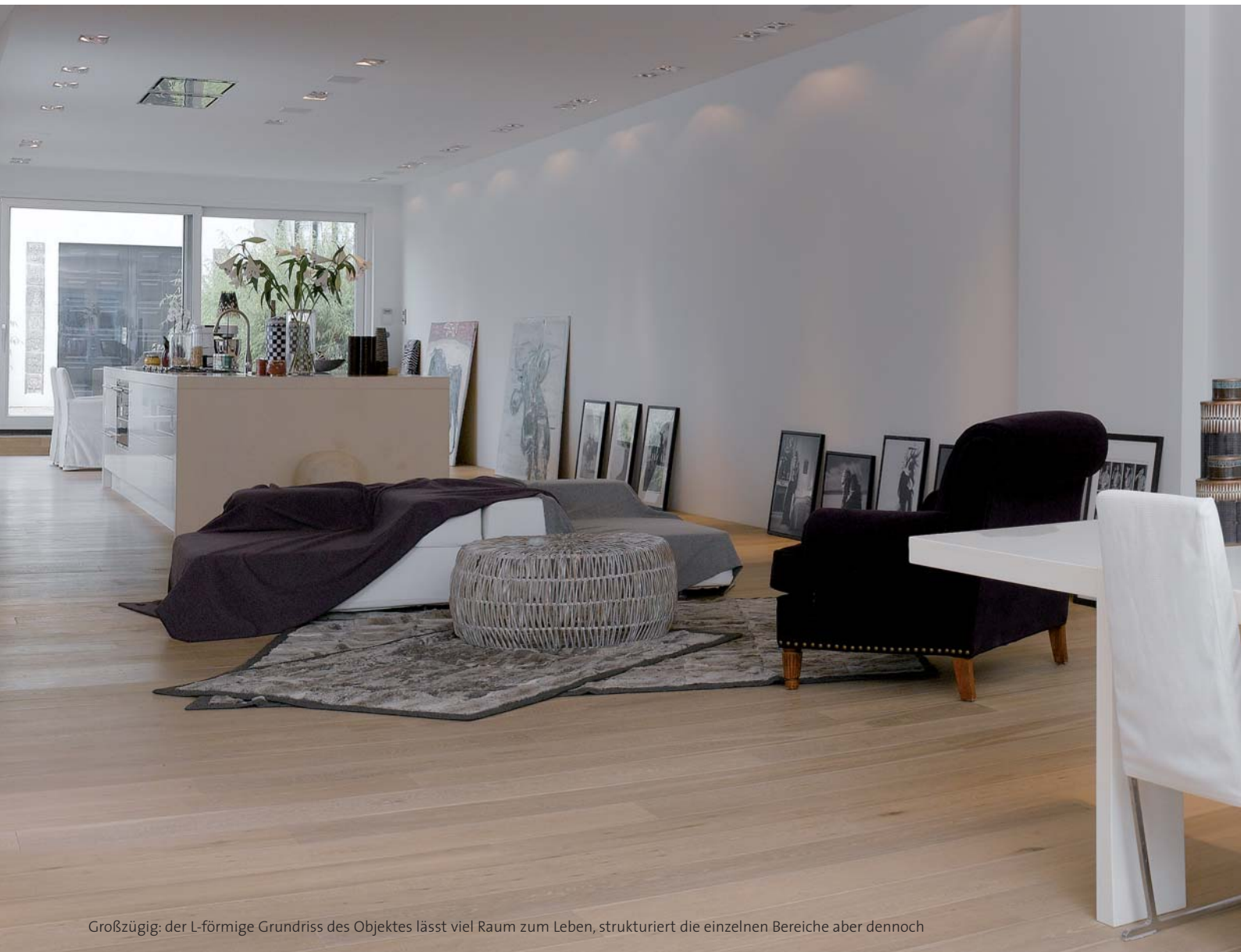
Großzügig: der L-förmige Grundriss des Objektes lässt viel Raum zum Leben, strukturiert die einzelnen Bereiche aber dennoch